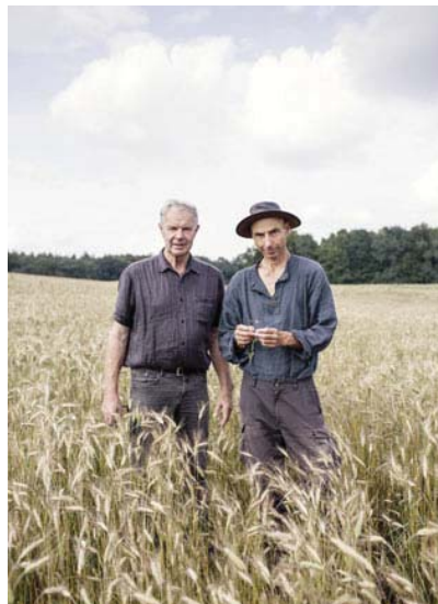
Ökoveisionäre Meyerhoff, Gottwald „Toleranz gegenüber Unkräutern“

Bauernpräsident Joachim Rukwied sorgt sich im SPIEGEL-Streitgespräch um Wett-